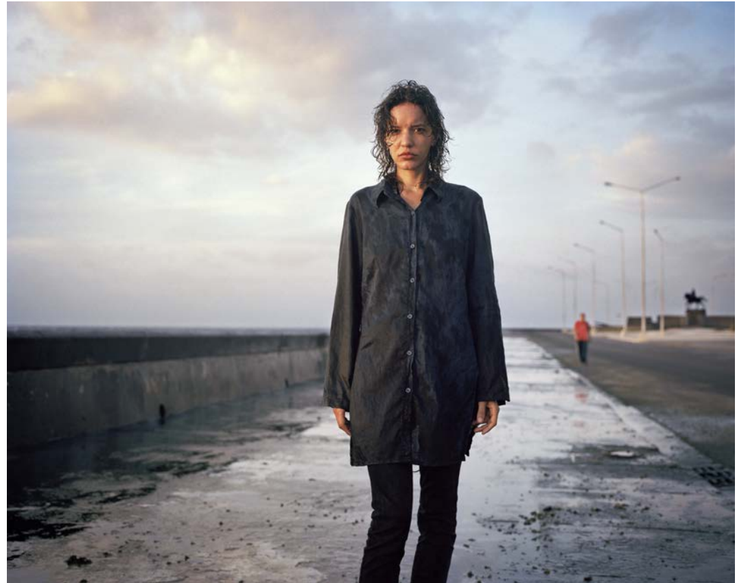
L'île , 2011, tirage argentique, 60 x 75 cm