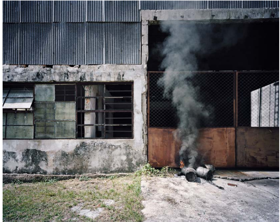
L'île , 2011, tirage argentique, 60 x 75 cm