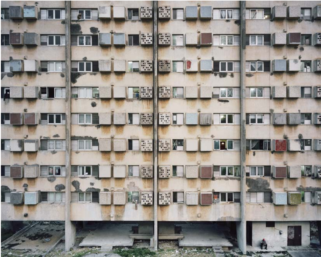
L'île , 2011, tirage argentique, 60 x 75 cm