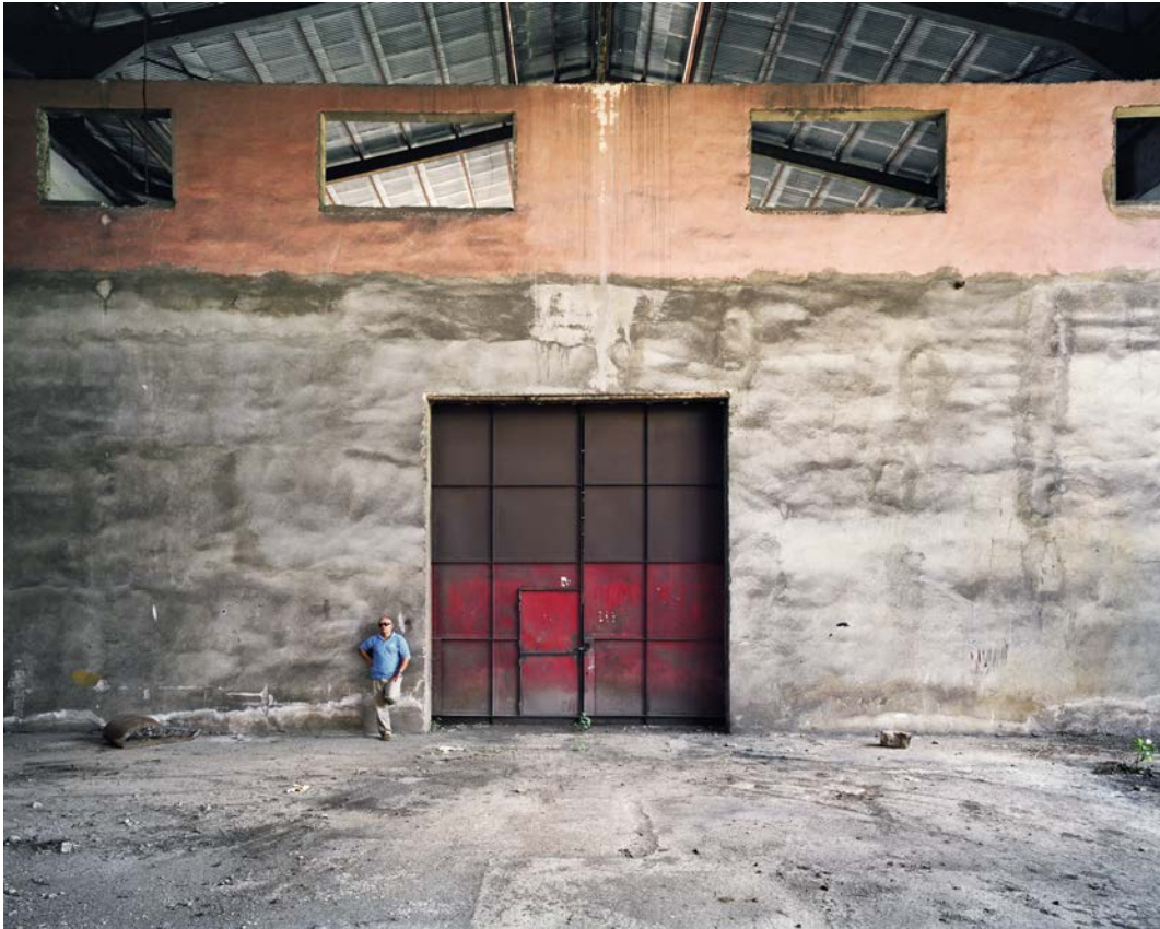
L'île , 2011, tirage argentique, 60 x 75 cm