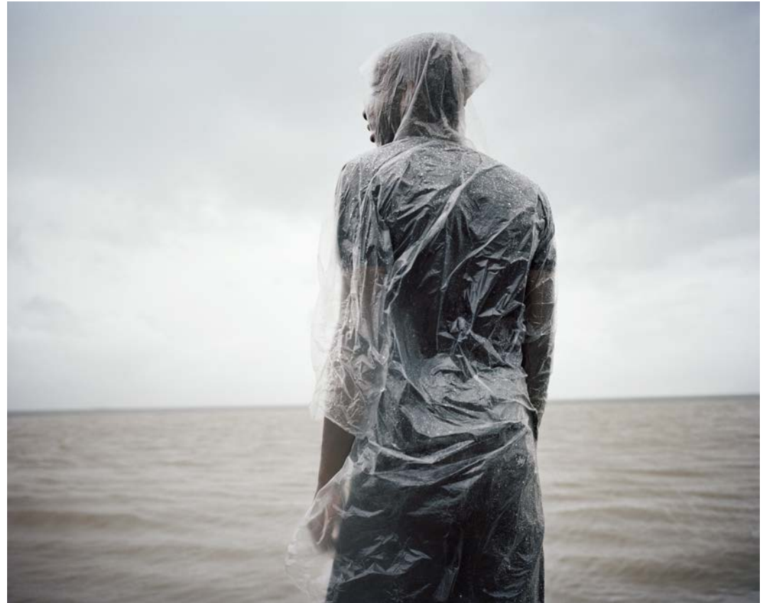
L'île , 2011, tirage argentique, 60 x 75 cm