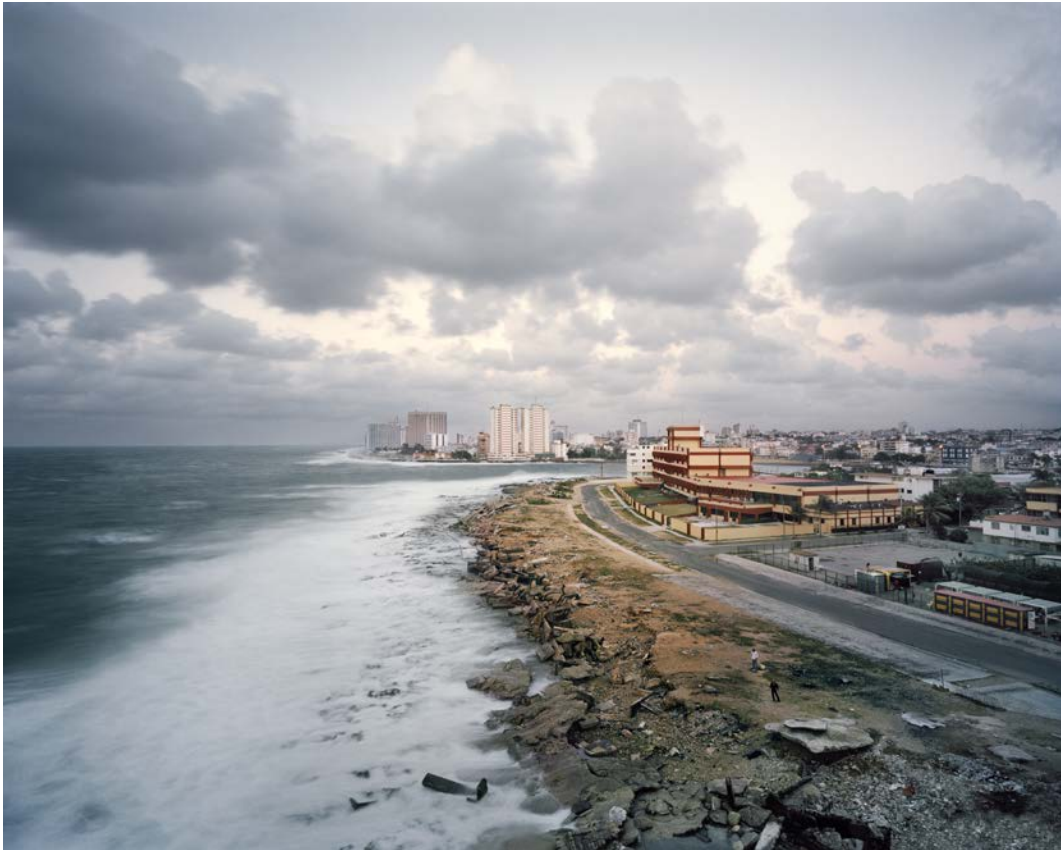
L'île , 2011, tirage argentique, 60 x 75 cm