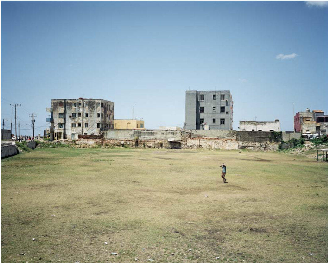
L'île , 2011, tirage argentique, 60 x 75 cm