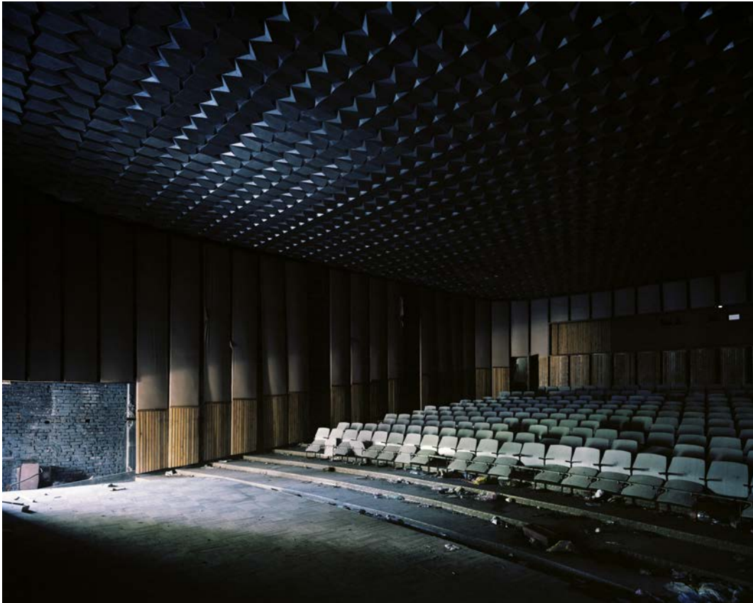
L'île , 2011, tirage argentique, 60 x 75 cm