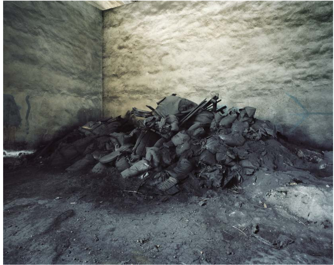
L'île , 2011, tirage argentique, 60 x 75 cm