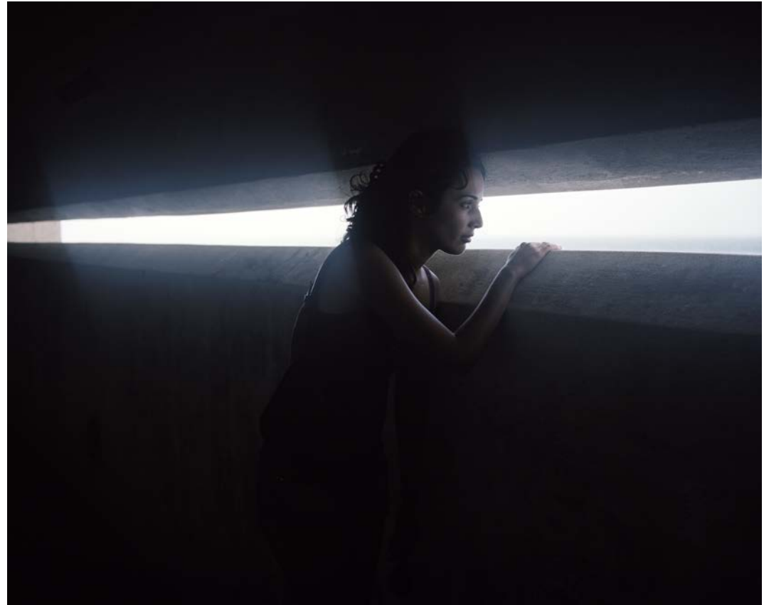
L'île , 2011, tirage argentique, 60 x 75 cm