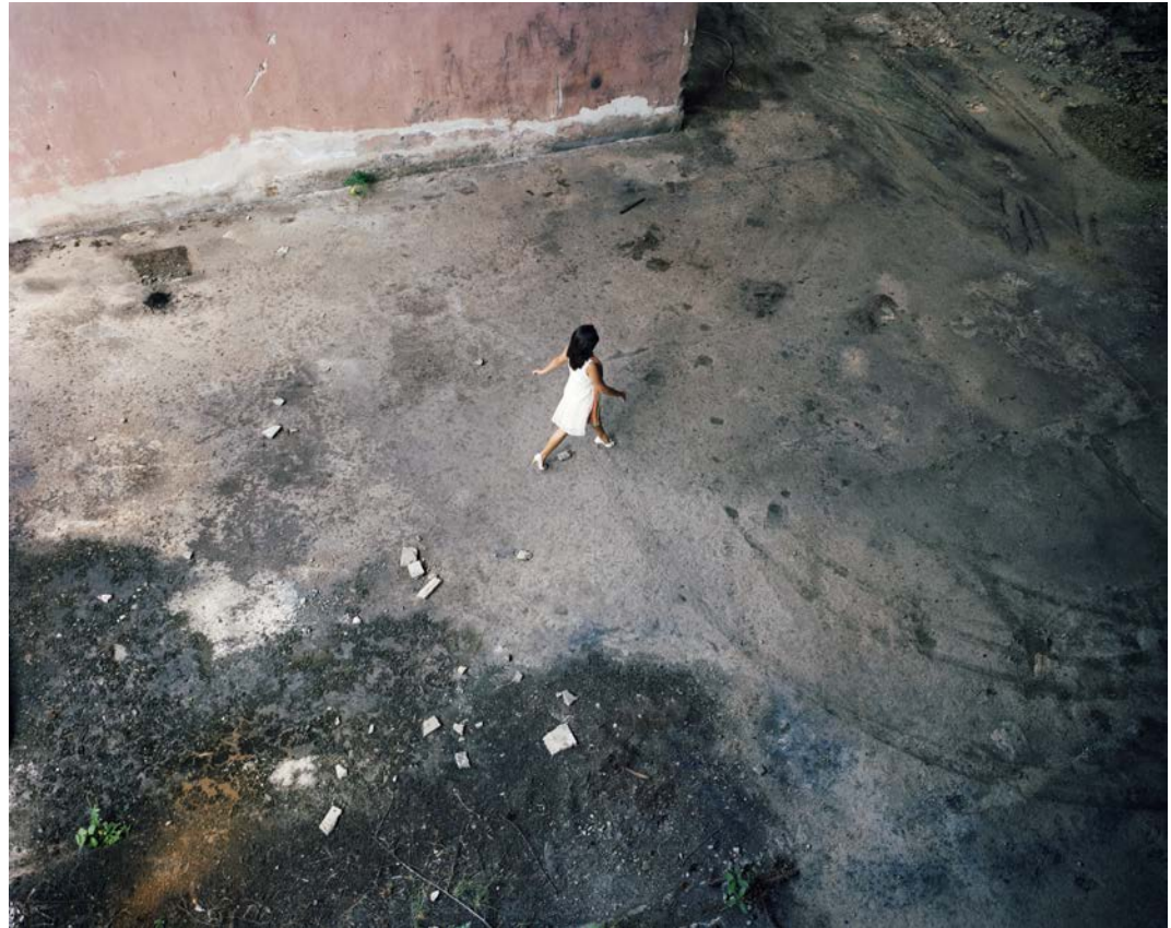
L'île , 2011, tirage argentique, 60 x 75 cm