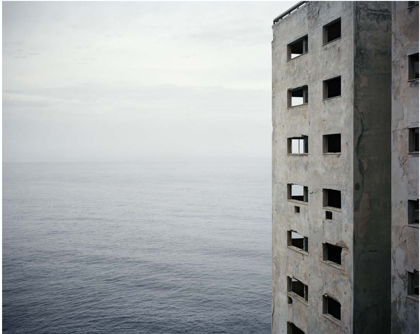
L'île, 2011, tirage argentique, 60 x 75 cm

Ce travail a été lauréat du prix International Photography Award (Los Angeles, 2012) et a été exposé à la Galerie Dar Al Anda (Amman, 2013) à l'initiative de l'Institut Français de Jordanie.