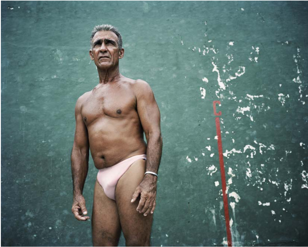
L'île , 2011, tirage argentique, 60 x 75 cm