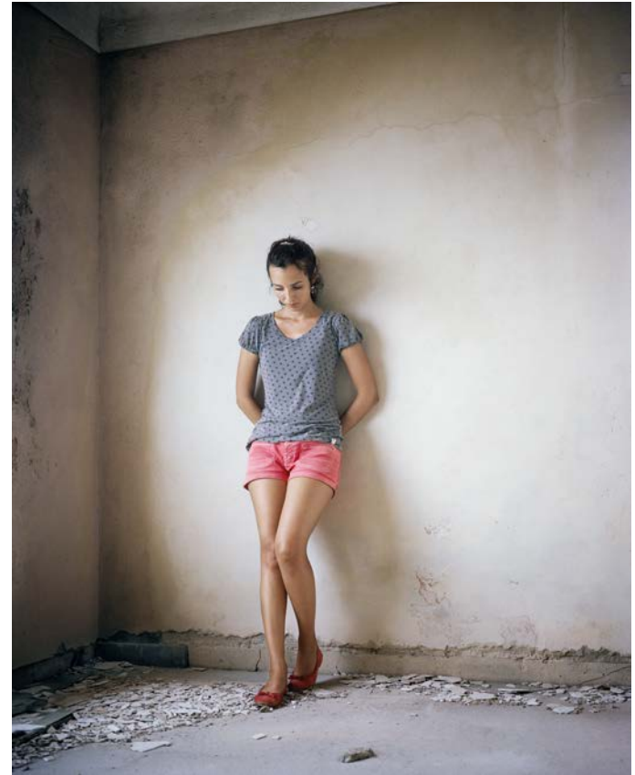
L'île , 2011, tirage argentique, 60 x 75 cm