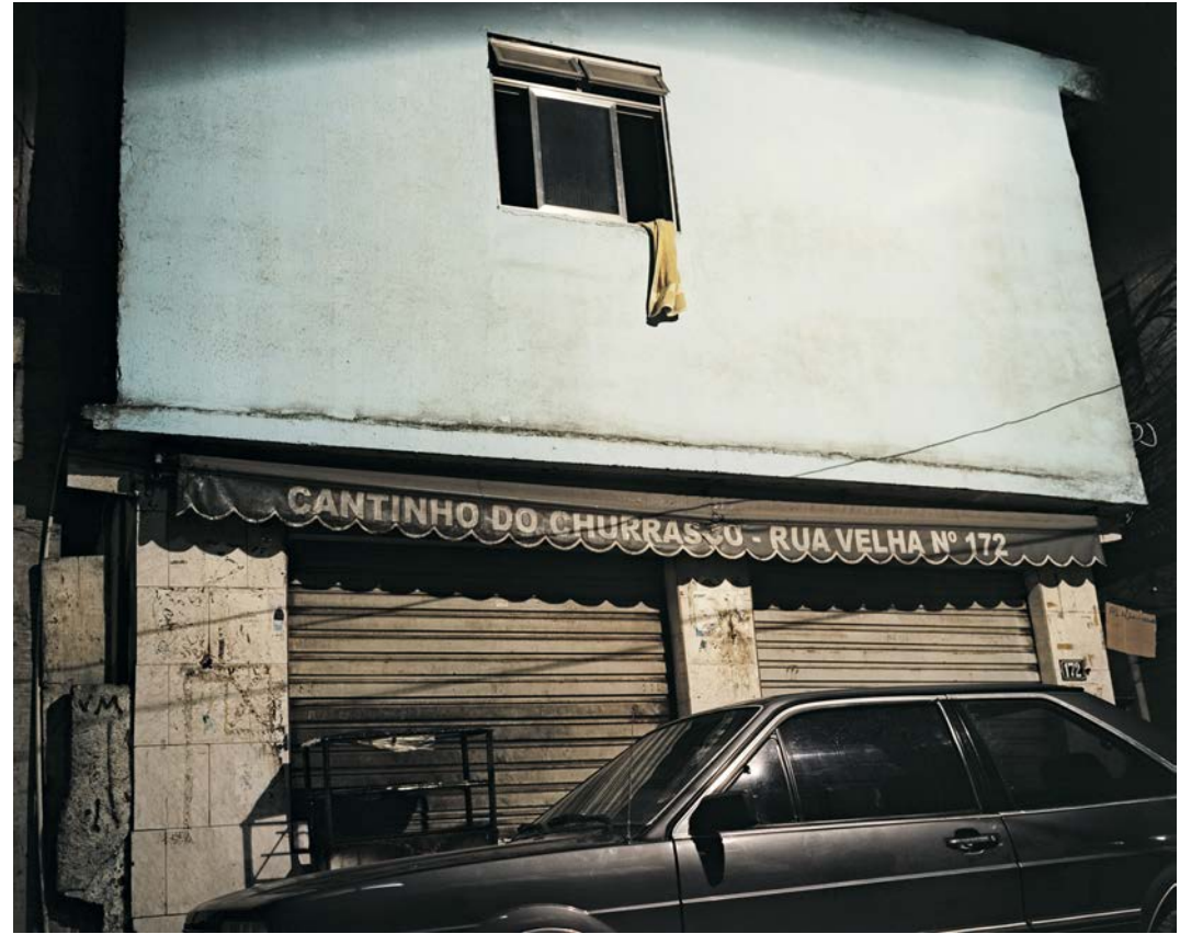
Jane la nuit tombe , 2010, tirage argentique, 60 x 75 cm