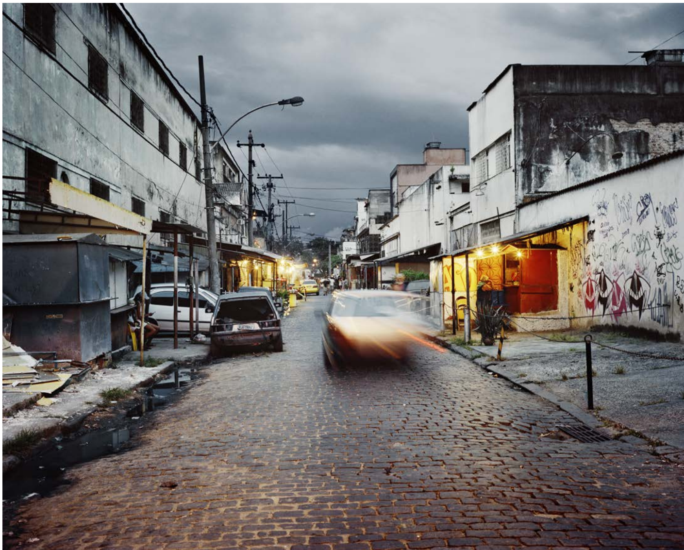
Jane la nuit tombe , 2010, tirage argentique, 60 x 75 cm