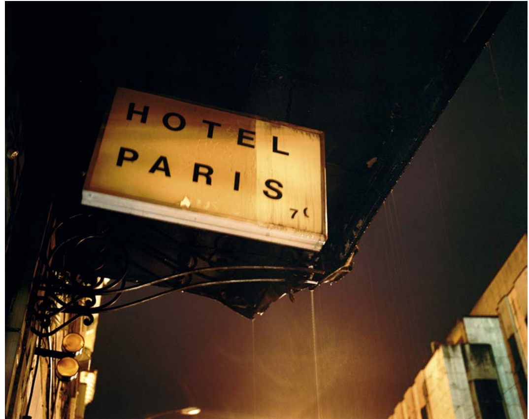
Jane la nuit tombe , 2010, tirage argentique, 60 x 75 cm