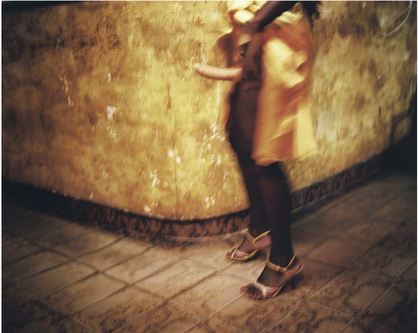
Jane la nuit tombe , 2010, tirage argentique, 60 x 75 cm