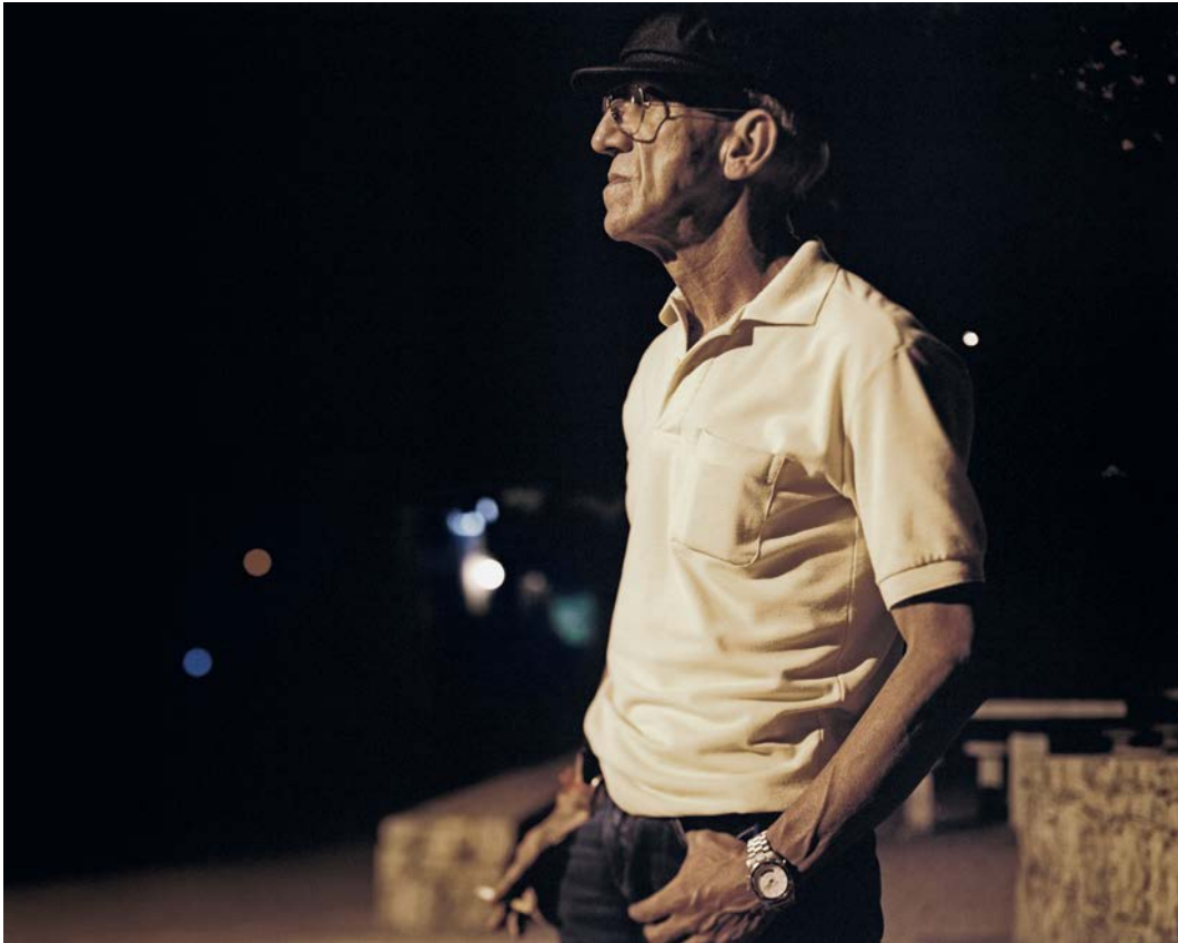
Jane la nuit tombe , 2010, tirage argentique, 60 x 75 cm