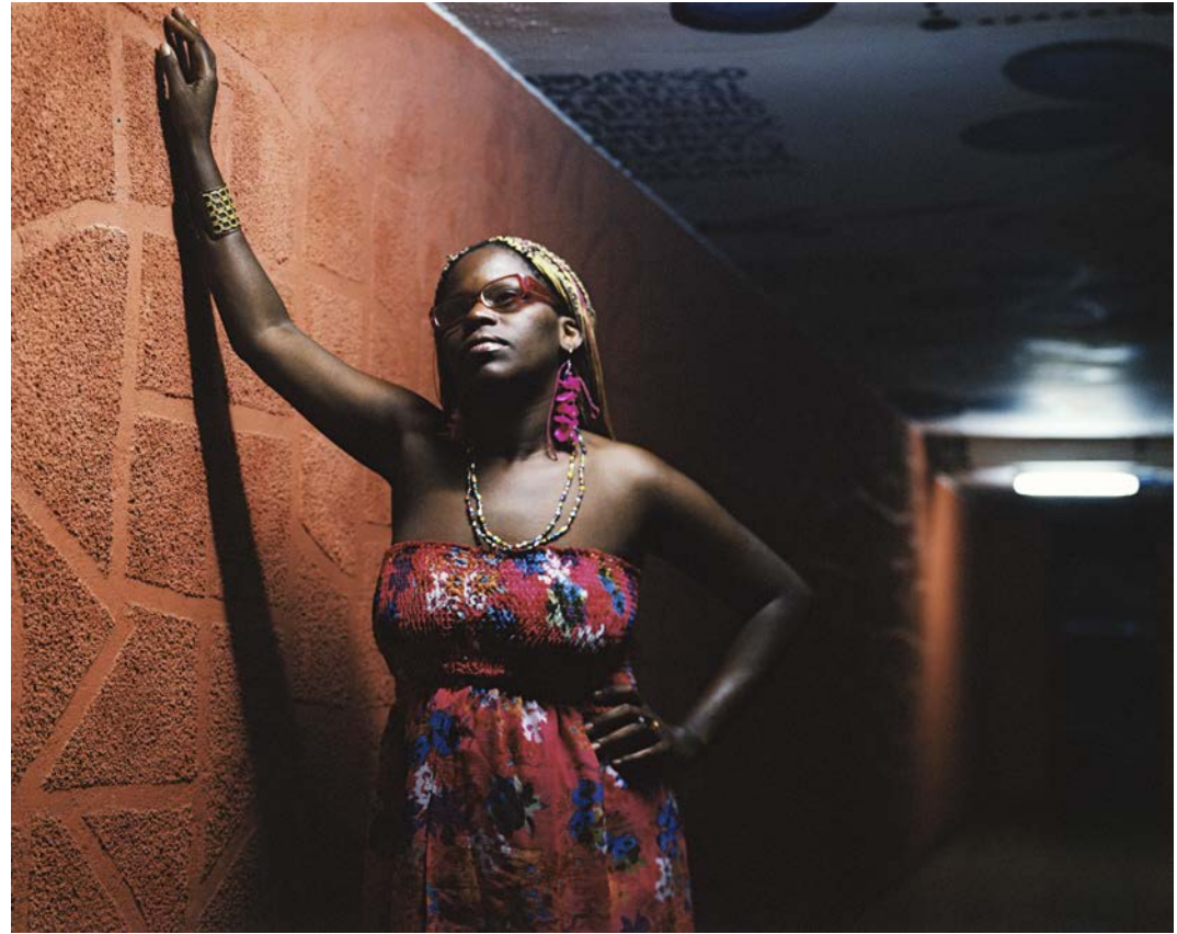
Jane la nuit tombe , 2010, tirage argentique, 60 x 75 cm