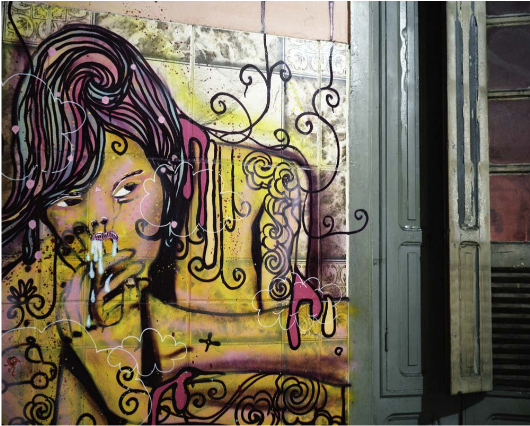
Jane la nuit tombe , 2010, tirage argentique, 60 x 75 cm