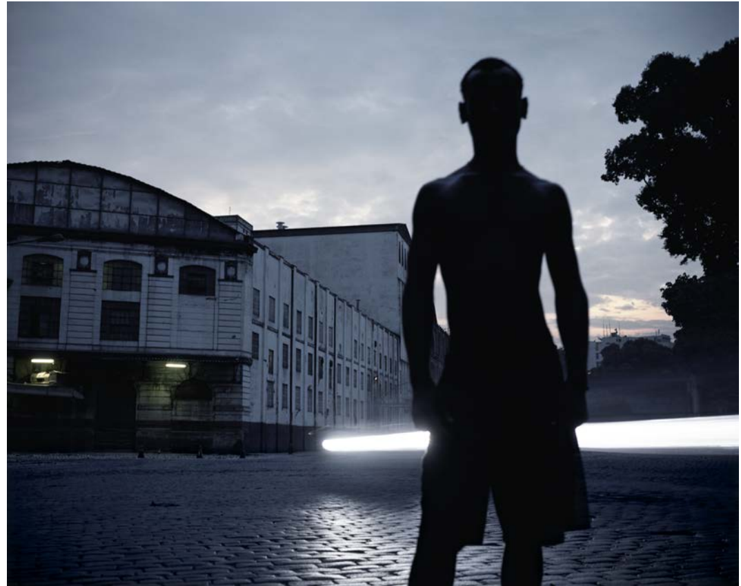
Jane la nuit tombe , 2010, tirage argentique, 60 x 75 cm