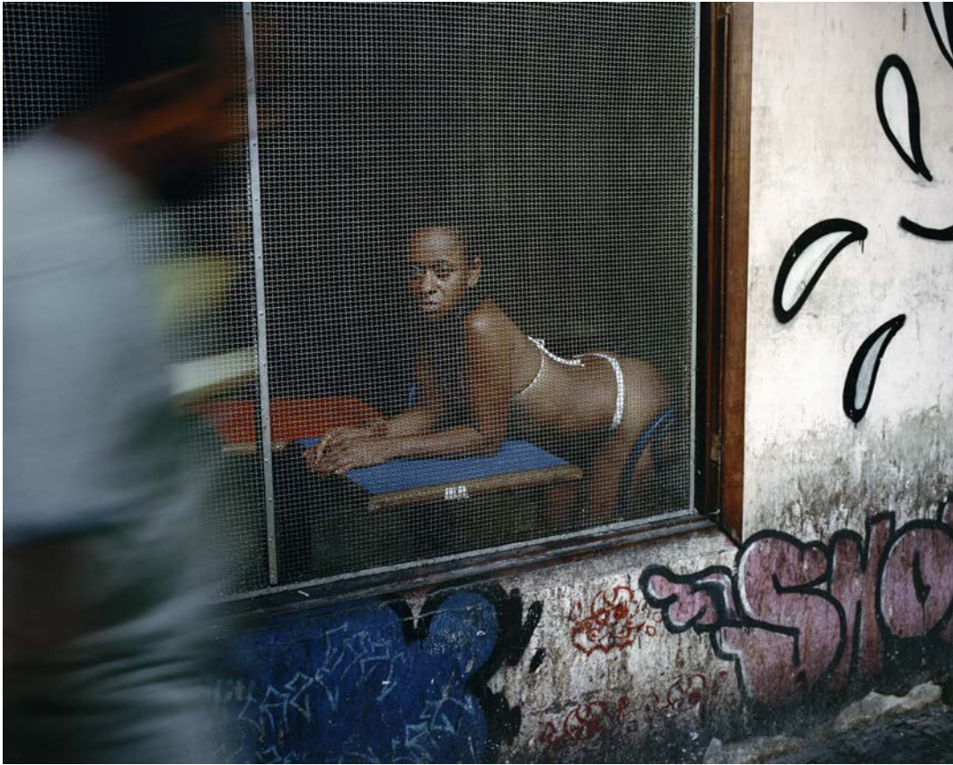
Jane la nuit tombe , 2010, tirage argentique, 60 x 75 cm