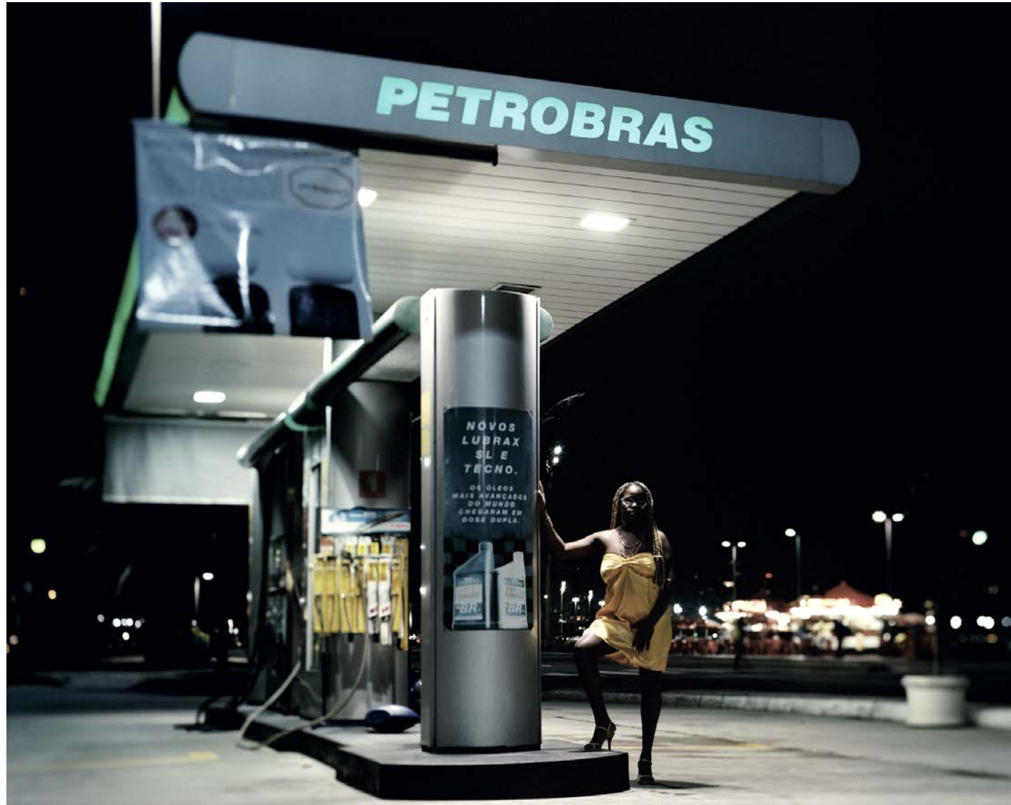
Jane la nuit tombe, 2010, tirage argentique, 60 x 75 cm

Ce travail a été exposé à la Galerie Dupon (Paris, 2011, commissariat de Pascale Giffard / Bureau des Rencontres d'Arles), au Centro de Artes Helio Oiticica (Rio de Janeiro, 2011, commissariat de Milton Guran / FotoRio) ainsi qu'à la Galerie du Point du Jour (Bagatelle, mars 2012).