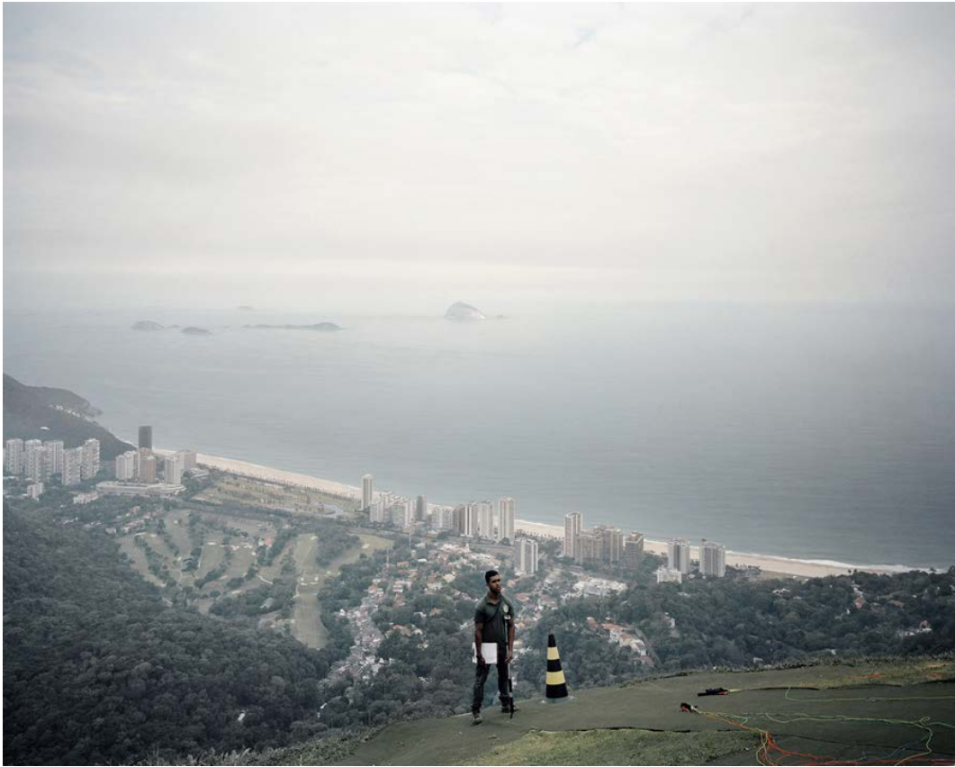
Rio corps de la ville , 2012, tirage argentique, 60 x 75 cm