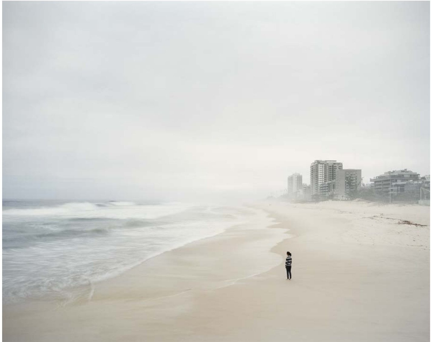
Rio corps de la ville, 2012, tirage argentique, 60 x 75 cm

Au cœur du territoire surcodé qu'est Rio de Janeiro, entre ses brumes humides et son soleil de plomb, son étirement infini et ses cloisonnements sans nombre, il y a une sensualité charnelle qui place l'individu au centre de tout. Mais les évolutions récentes de la ville semblent aujourd'hui y étirer l'espace au-delà de la dimension de l'homme. Sous l'effet d'un basculement en temps réel, propice à l'égarement et à la désorientation, la cartographie mentale de Rio se brouille et transgresse sa territorialité pour poser une question d'ordre universelle : celle de notre rapport au monde. Construit autour de la figure de l'entre-deux, ce travail en cours interroge cette tension transitoire et ses représentations subjectives : l'attente, le vide, le flottement. De cette recherche résultent des images ambiguës, suspendues entre l'évanouissement et la résurgence d'un ordre.