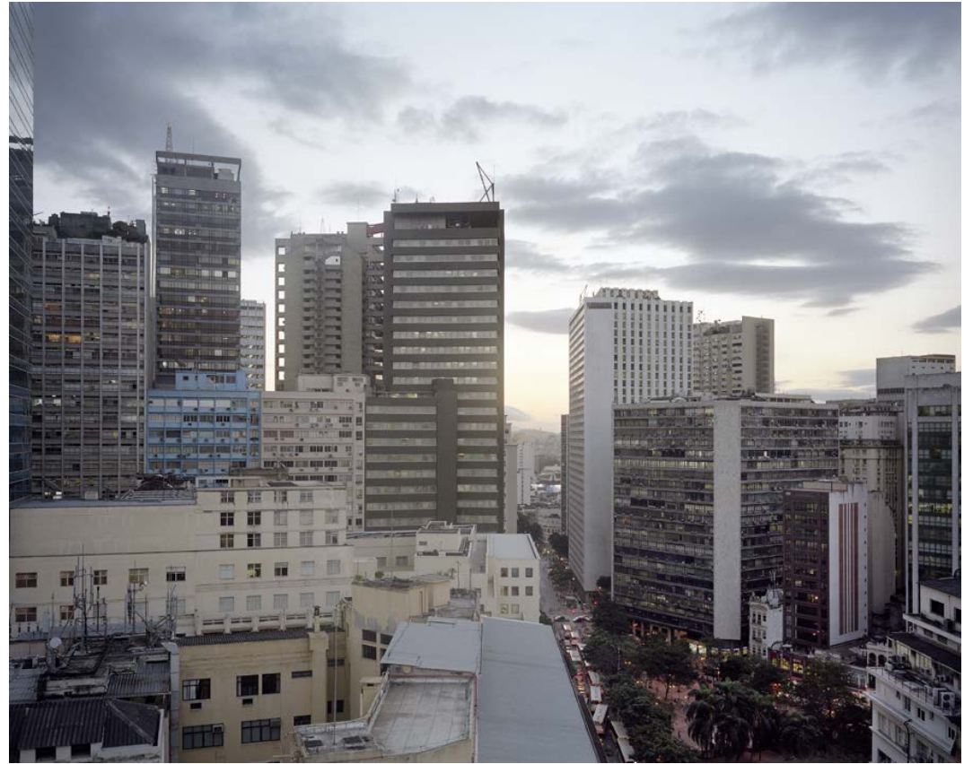
Rio corps de la ville , 2012, tirage argentique, 60 x 75 cm