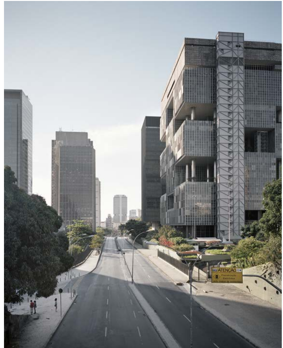
Rio corps de la ville , 2012, tirage argentique, 60 x 75 cm