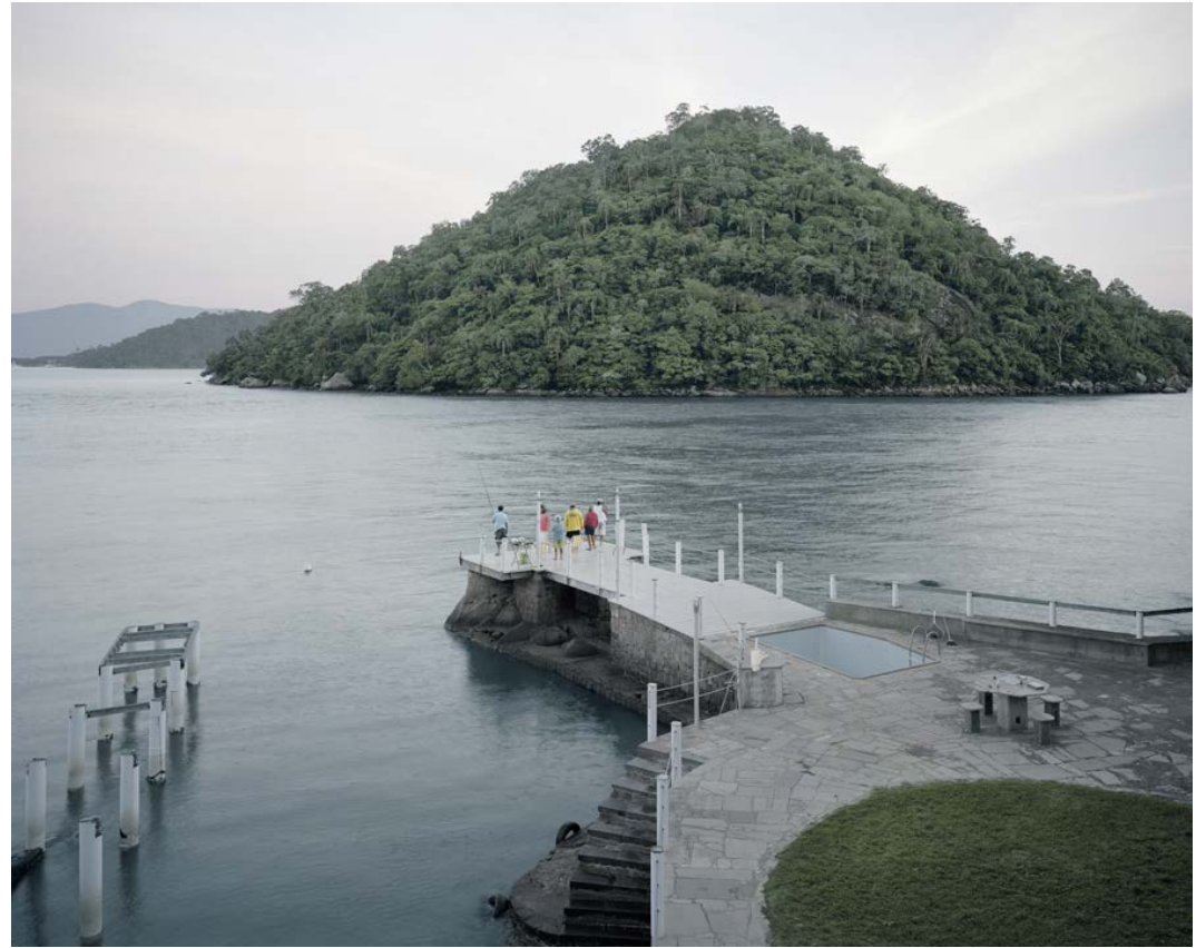
Rio corps de la ville , 2012, tirage argentique, 60 x 75 cm